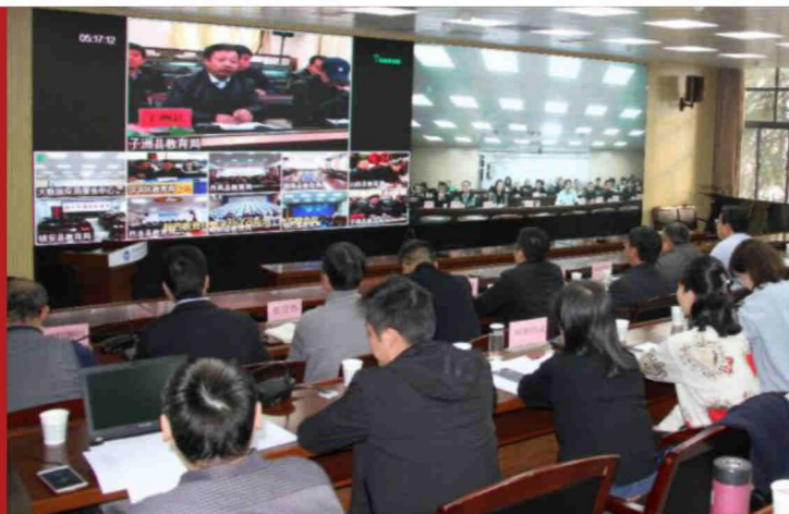
陕西教育扶智平台 试点应用工作专题 会议主会场